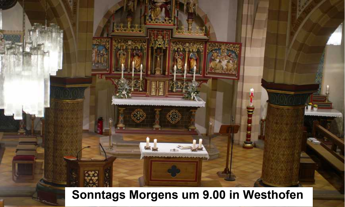
Sonntags Morgens um 9.00 in Westhofen