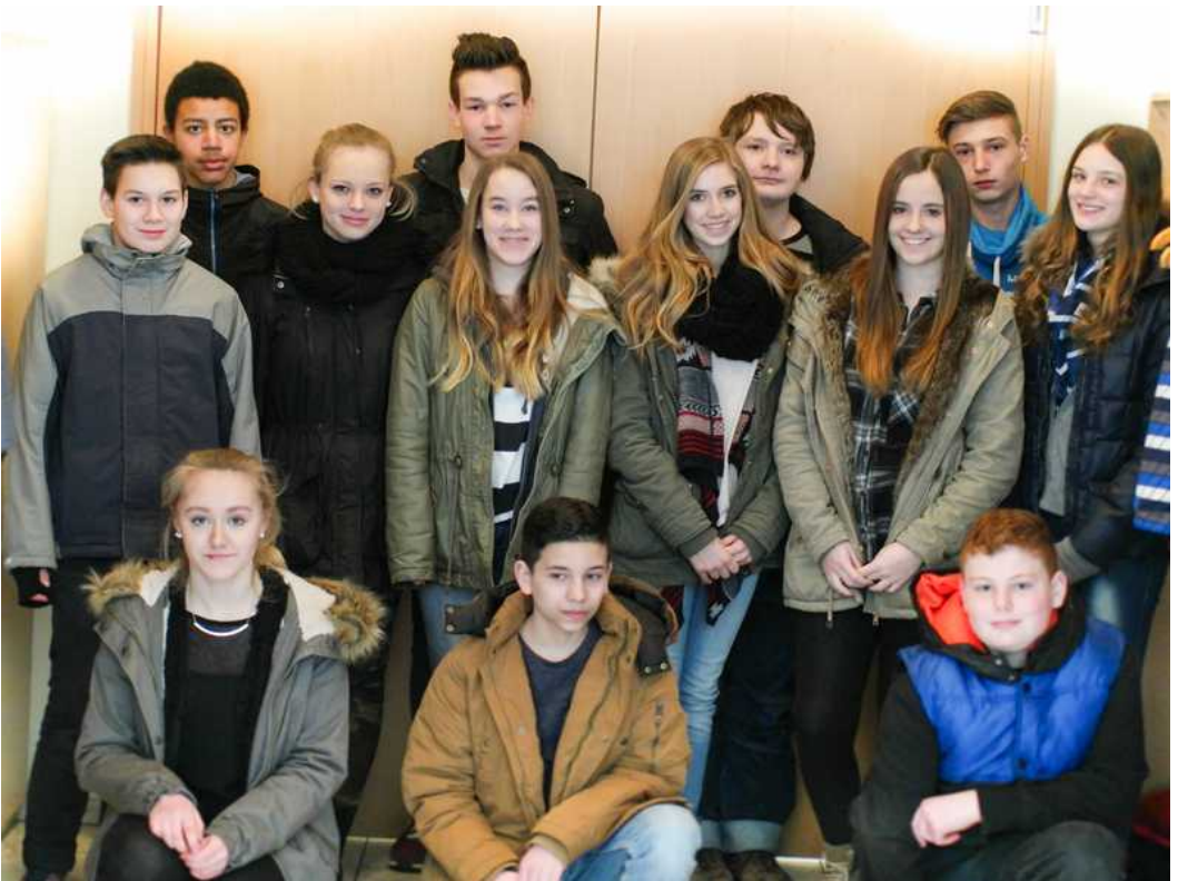
Firmbewerber in unserer Pfarrgruppe